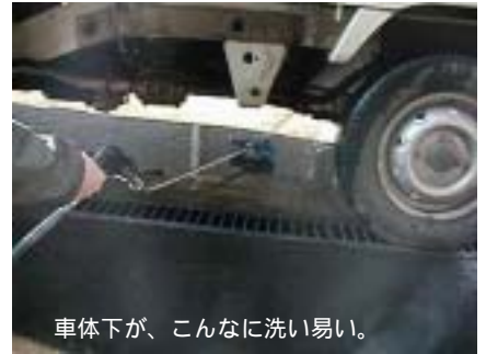
車体下が、こんなに洗い易い。