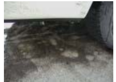
ノージャッキでも効果バツグン

特に、車高が低い車などを洗う場合に、洗車サービスは勿論、整備場やご家庭でもお奨めです。先端がL形に曲がった長いランスを使った場合と比較して、噴射の反力が無く、狙った位置を覗き込んでいる必要も有りません。洗い難い場所がとても簡単に洗え、洗浄水の返り水や、腰が痛くなる、嫌な作業では無くなるでしょう。